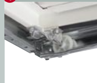
4 Végállás biztosítás

Felsővégállás biztosítással a kapu biztonságosan nyugalmi állapotba kerül.